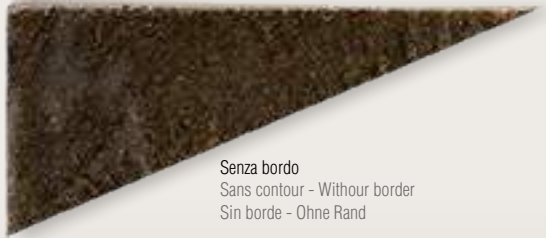
Senza bordo Sans contour - Without border Sin borde - Ohne Rand