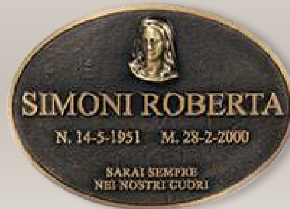
P T0134 cm 36x26