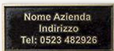
T0265 cm 8x4

A richiesta si possono avere anche con applicazione a terreno