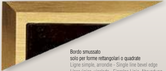
Bordo smussato solo per forme rettangolari o quadrate Ligne simple, arrondie - Single line bevel edge Línea única, viselada - Einzelne Linie, Abrundung