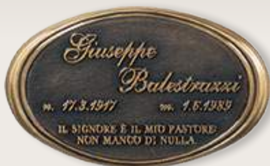
P T0023 cm 36x22