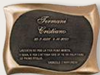
P T0017 cm 36x27