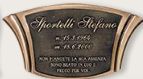
P T0177 cm 24x12 P T0024 cm 43x23