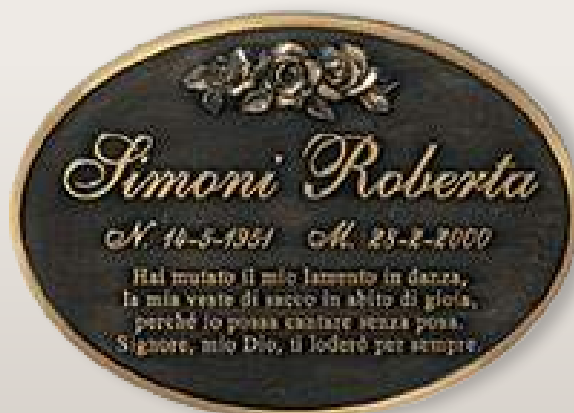
P T0015 cm 36x26