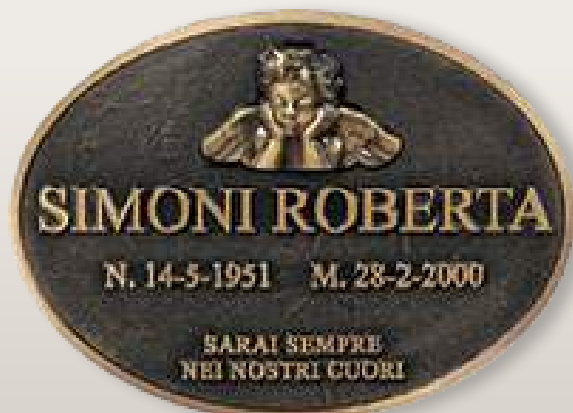
P T0133 cm 36x26

Plaketten mit künstlerischer patina für grabnischen und grabmäler