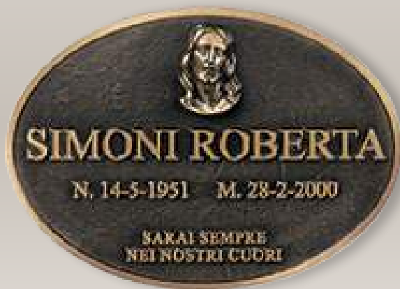
P T0135 cm 36x26