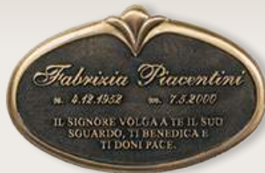
P T0178 cm 18x12