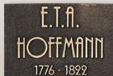
Concava spigoli vivi P T0238 cm 427x18 Esempio di Carattere Vittoriano