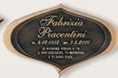
P T0176 cm 18x12 P T0016 cm 36x26