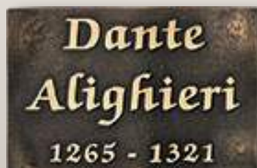
Ondulata P T0234 cm 427x18 Esempio di Carattere Francescano