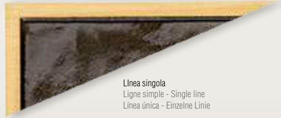
Linea singola Ligne simple - Single line Línea única - Einzelne Linie